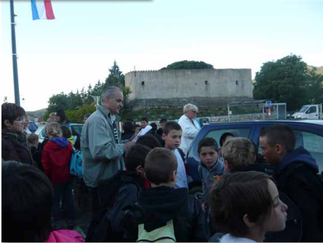
La distribution des repas à tous les p'tits Loups