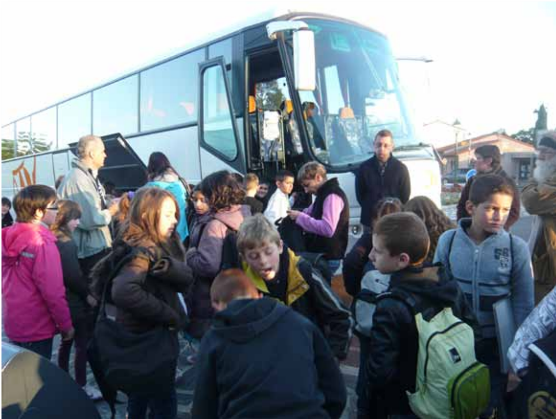
Embarquement immédiat, direction la Cité de l'Espace