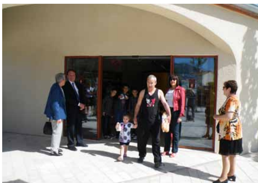
Ouverture de la Boulangerie dans des locaux de qualité spacieux et fonctionnels.

Rassurons les St-Jeannais qui connaissent le passé du village, cette projection vers l'avenir n'occulte en rien la place ancestrale : celle de la République. Elle demeure et reste le poumon affectif du village, par sa notoriété et sa beauté. Un patrimoine que chacun se doit d'honorer lors des ballades , manifestations et fêtes qui s'y déroulent à la belle saison.