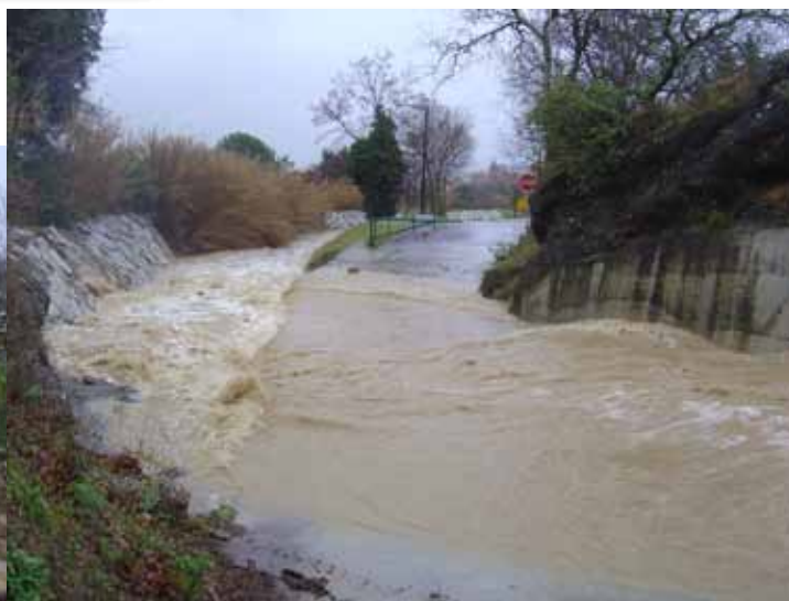
La rivière de Las Aigues