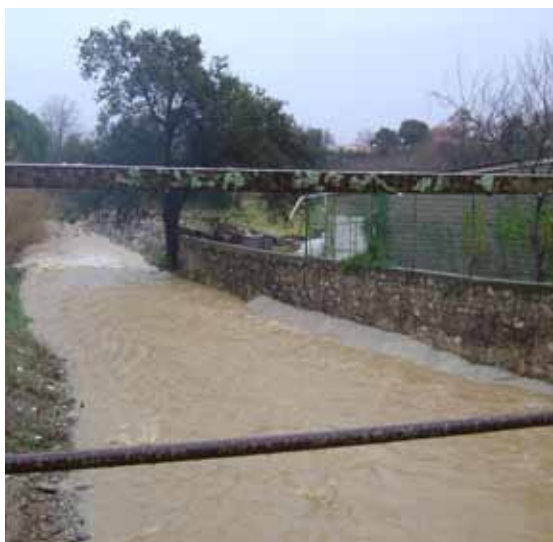
Rivière de Vivès à Cami de Conangles