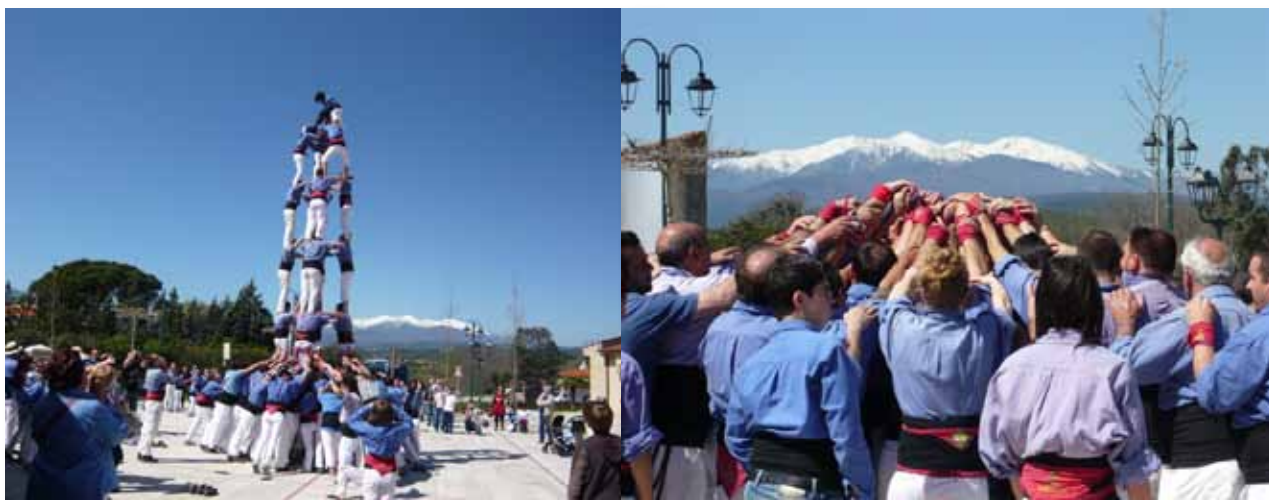
Diada Castellera avec Marrecs de Salt le 14 avril dernier