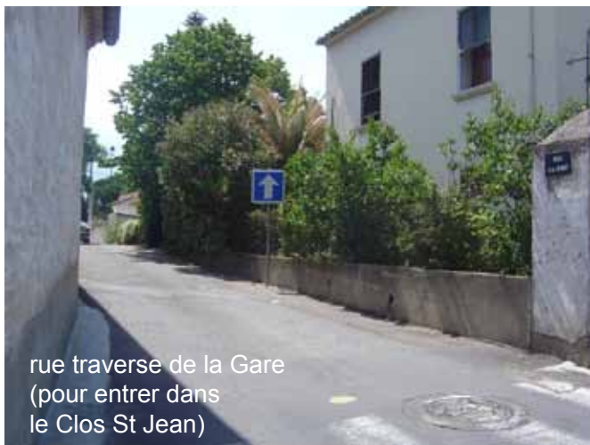
rue traverse de la Gare (pour entrer dans le Clos St Jean)

Office religieux, vide greniers et sardanes complétaient une fête traditionnelle.