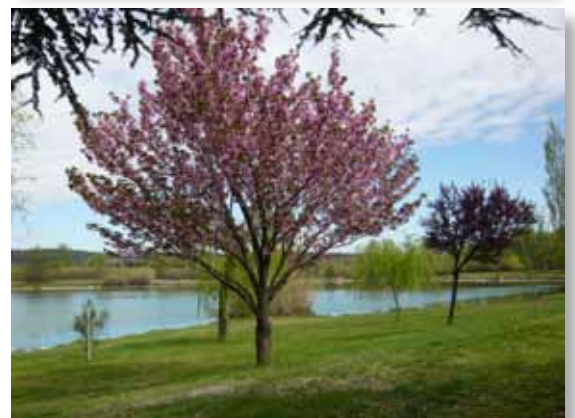
avant que n'apparaissent les fleurs printanières le 3 avril...