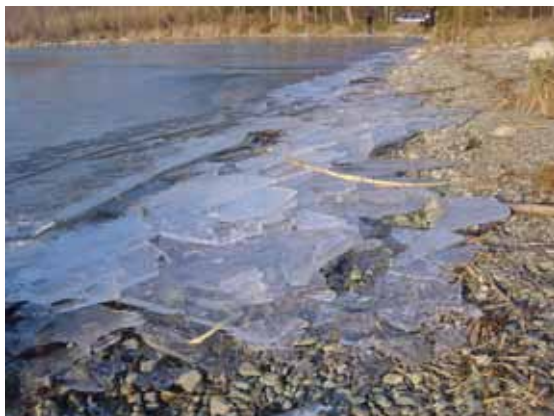
Au plan d'eau le spectacle inhabituel de la glace qui se brise sur les berges gelées le 11 février