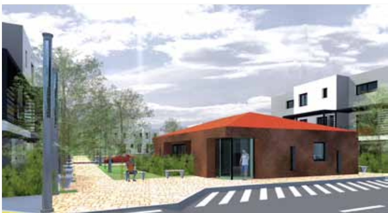
Vue de la promenade avec en premier plan la Maison d'Assistants Maternels «Les papillons»

C'est au cœur même de cette résidence que sera implantée dans des locaux agrémentés d'un espace ludique extérieur, la Maison d'Assistants Maternels agréés «Les papillons». Cette nouvelle structure adaptée à la petite enfance répondra en tous points aux exigences légales relatives à la santé et la sécurité des enfants.